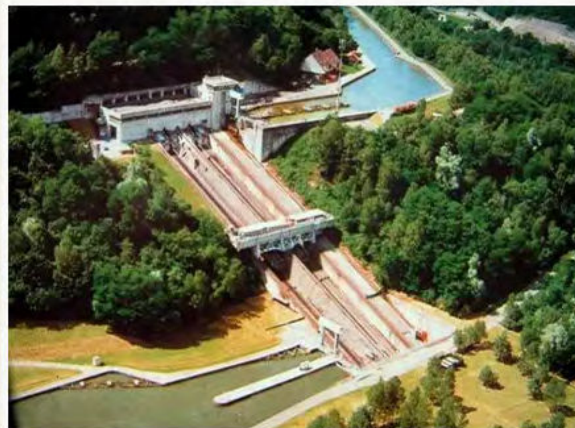
Plan incliné Arzwiller

Le champ des possibles est ouvert. On peut aussi allier travail et plaisir, grâce aux deux salles de réunion pour des séminaires au vert permettant d'accueillir ses collaborateurs dans un cadre d'exception. Ouvert toute l'année, l'hôtel est à la fois une destination loisirs, une destination business et une destination bien-être et nature.